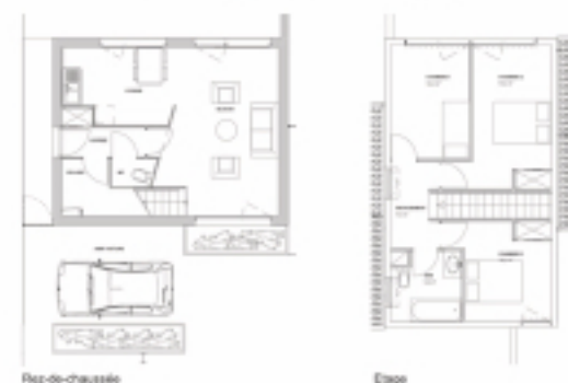
PLAN LOGEMENT TYPE T4